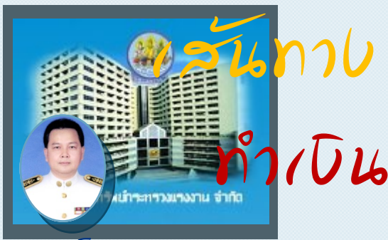
โดย นายหนอก แอ้วทองเล็ก