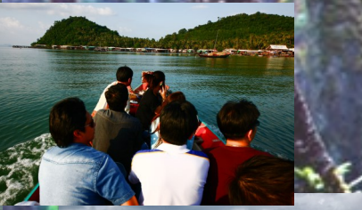
มีบริการให้เช่าเรือ ลှยัก ใ้พายเล่นด้วย..