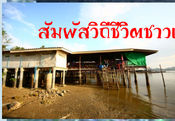
สัมผัสวิถีชีวิตชาวเกาะที่ยังใช้ชีวิตแบบชาวเล..